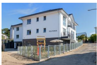
Essplatz und Küchenzeile