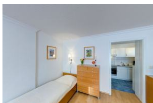
Schlafmöglichkeit für 3. Person