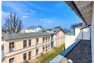
Dachterrasse (Blick seitlich)