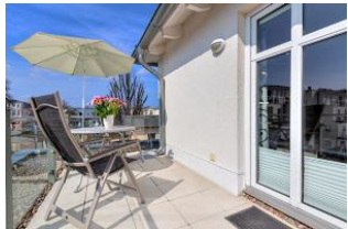
Dachterrasse nach Süden mit Essplatz